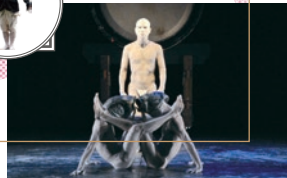
2013年 川根本町文化会館公演【はまじ】